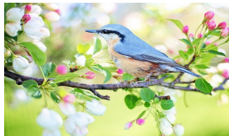
Vogel im Baum

Eine Art ist die kleinste Gruppe von Tieren, die sich untereinander, jedoch nicht mit Angehörigen anderer Arten fortpflanzen können. Ihre Nachkommen müssen sich ebenfalls erfolgreich fortpflanzen können. Angehörige derselben Art sehen normalerweise sehr ähnlich aus. Menschen gehören alle zur Art Homo sapiens.