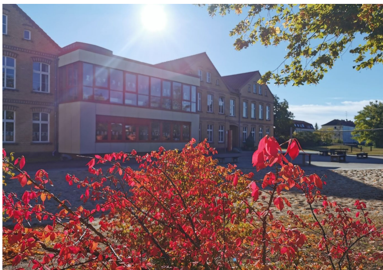
Unsere Schule im Herbst

A, 08.09.2020 haben wir so gut wie gar keinen Abfall gefunden.